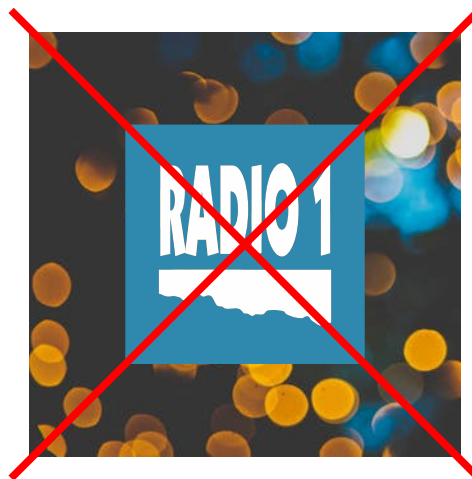
změna barvy loga