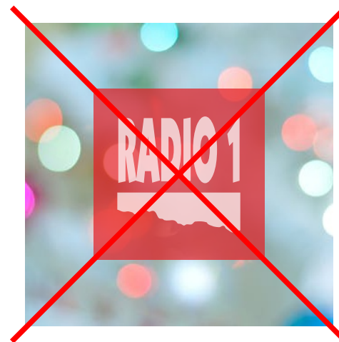
průsvitnost a jiné efekty

Dále je nepřipustné jakkoliv deformovat logo, měnit písmo, přidávat prvky do loga, otáčet ho a jinak zasahovat do loga. Je také zakázáno používat předešlá loga Radia 1!