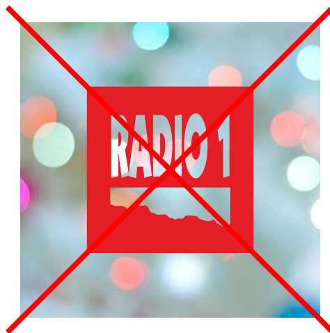
vnitřní grafika není plnobarevná