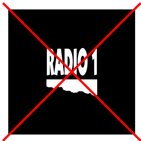
chybí podkladový čtverec